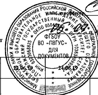
График работы ГЭК по защите выпускных квалификационных работ 2018/2019 уч.год (май - июнь)